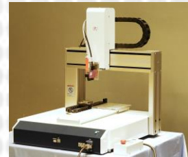
ピエゾジェット ディスペンサーモデル